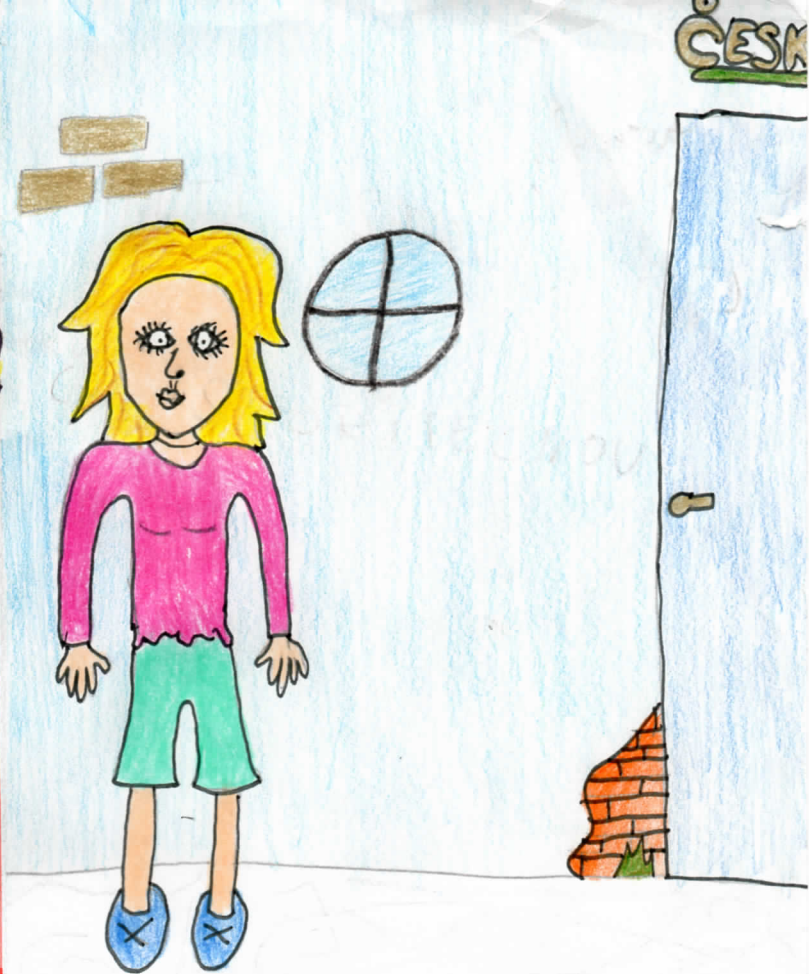
Aneta se připravuje na příchod do banky.