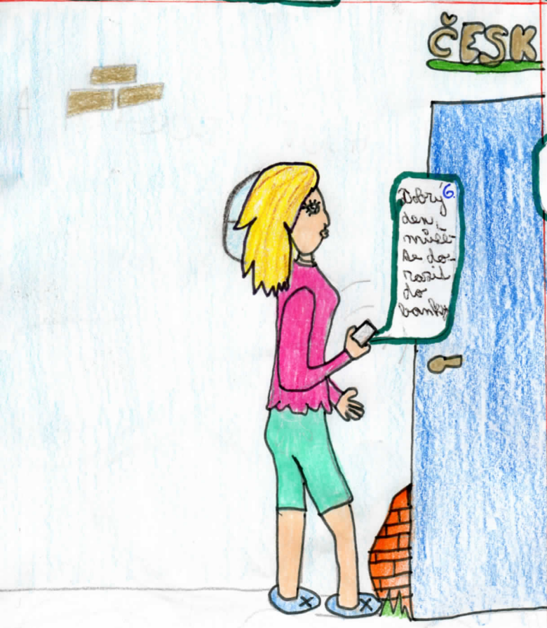
Najednou ji někdo zavola a řekne jí, ať přijde do české spořitelny.